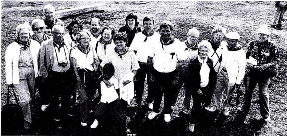
Sourires des plus entreprenants au sommet des 1482 m de la Dent.

Ce sont près de trente citoyens américains qui découvraient cet été la Suisse, pour la première fois pour bon nombre d'entr'eux. Invités à suivre leur étape à La Vallée, nous ne résistons pas au plaisir de vous faire partager leur itinéraire et leur histoire.