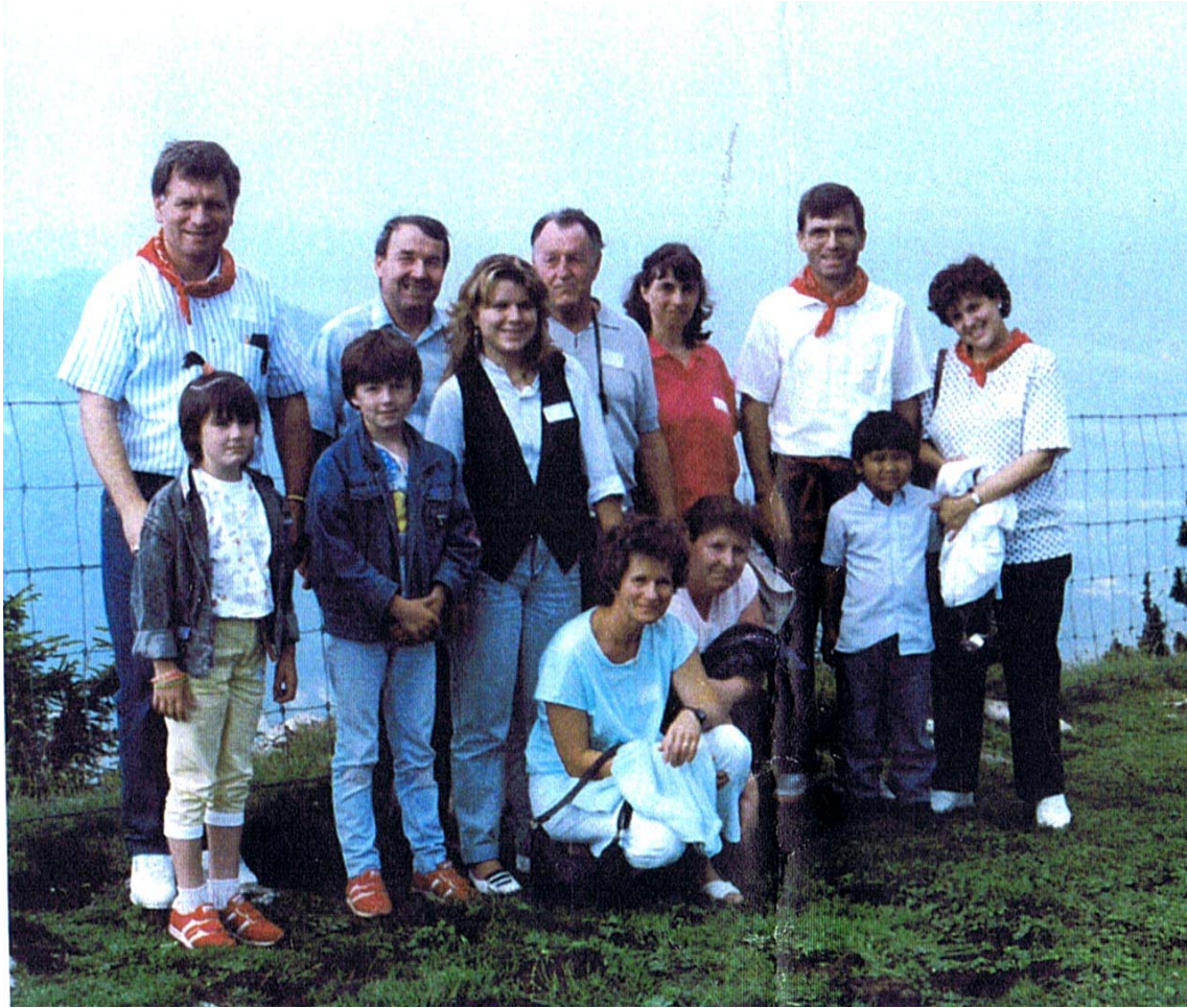
Quelques-uns des participants sur le sommet de la Dent de Vaulion.